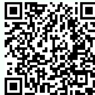
REGLAMENTO INTERNO 2024